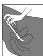
Bild 3. Einmal-Applikator von der Tube abnehmen, möglichst tief in die Scheide einführen (am besten in Rückenlage) und durch Druck auf den Kolben entleeren.

Bild 2. Tube öffnen, Einmal-Applikator auf die Tube aufsetzen, fest angedrückt lassen und durch vorsichtiges Drücken der Tube füllen.