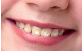
Beispiel einer Zahnfluorose mittlerer Ausprägung

Bei Fluorosen handelt es sich um kreidig-weiße Schmelzflecken auf den bleibenden Schneide-Zähnen . Hervorgerufen werden sie durch eine Störung der Mineralisation während der Zahnreifung. Ursache ist eine zu hohe Fluoridaufnahme in der Phase der Zahnreifung. Als besonders sensibel gilt die Phase um das zweite und dritte bis hin zum fünften Lebensjahr.