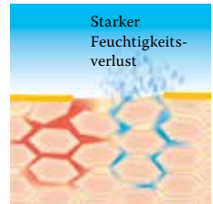
Lipidverlust führt zu einer gestörten Hautbarriere: Die Haut verliert viel Wasser und trocknet aus.