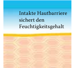
Intakte, schützende Hautbarriere mit Linolsäure-reichen Lipiden.

Linola Hautmilch, Linola Gesicht, Linola Hand und Linola Fuß-Milch sowie zu weiteren Linola-Produkten bei verschiedenen Hautproblemen bereitgestellt.