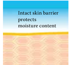
Intact protective skin barrier with lipids rich in linoleic acids.

Visit us at www.linola.com and select the drop-down menu "country". Here you will find all the latest information on Linola Lotion, Linola Face, Linola Hand and Linola Foot Lotion as well as other Linola products for a wide range of skin problems.