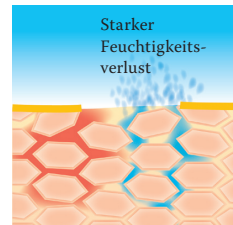
Lipidverlust führt zu einer gestörten Hautbarriere: Die Haut verliert viel Wasser und trocknet aus.