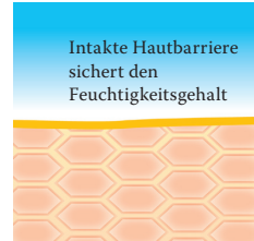
Intakte, schützende Hautbarriere mit Linolsäure-reichen Lipiden.

Besuchen Sie uns unter www.linola.de . Denn dort haben wir für Sie alle aktuellen Informationen über Linola Hautmilch , Linola Gesicht , Linola Hand und Linola Fuß-Milch sowie zu weiteren Linola-Produkten bei verschiedenen Hautproblemen bereitgestellt.