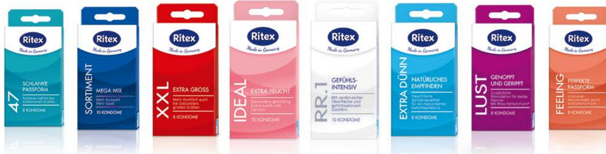
47 SCHLANKE PASSFORM

Hergestellt aus Naturkautschuklatex, einem natürlichen Rohstoff des Gummibaums, ermöglichen Ritex Kondome ein intensives und besonders natürliches Gefühl. Sie sind hochelastisch und passen sich optimal allen Penisgrößen an – wie eine zweite Haut.