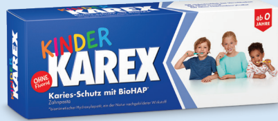
Kinder Karex Zahnpasta, 50 ml, PZN: 14299617