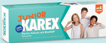
Junior Karex Zahnpasta, 65 ml, PZN: 17817283