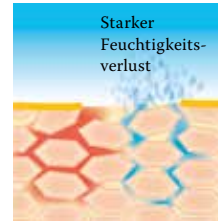
Lipidverlust führt zu einer gestörten Hautbarriere: Die Haut verliert viel Wasser und trocknet aus.

dungen, Juckreiz und Ekzemen neigt. Um diesen Barrierestörungen sowie Fett- und Feuchtigkeitsdefiziten trockener Haut entgegenzuwirken und sie vor weiteren Schäden zu schützen, ist daher sowohl eine regelmäßige Pflege als auch eine schonende Reinigung unerlässlich. Deshalb gibt es von Linola spezielle Produkte, die aufeinander abgestimmt sind und zudem gerade für den Körper, den Kopf, das Gesicht, die Hände oder die Füße besonders geeignet sind. Besuchen Sie uns unter www.linola.de . Denn dort haben wir für Sie alle aktuellen Informationen über Linola Hautmilch , Linola Gesicht , Linola Hand und Linola Fuß-Milch sowie zu weiteren Linola-Produkten bei verschiedenen Hautproblemen bereitgestellt.