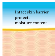
Intact protective skin barrier with lipids rich in linoleic acids.

Regardless of whether there is an internal or external cause, the result is always the same - a dry, flaky and brittle skin, which is more prone to inflammation, itching and eczema. Regular care is vital therefore to counteract this breakdown in barrier func-