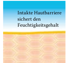
Intakte, schützende Hautbarriere mit Linol-säure-reichen Lipiden.

Besuchen Sie uns unter www.linola.de . Denn dort haben wir für Sie alle aktuellen Informationen über Linola Hautmilch , Linola Gesicht , Linola Hand und Linola Fuß-Milch sowie zu weiteren Linola-Produkten bei verschiedenen Hautproblemen bereitgestellt.