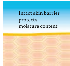
Intact protective skin barrier with lipids rich in linoleic acids.

Visit us at www.linola.de and select the drop-down menu "country". Here you will find all the latest information on Linola Lotion, Linola Face, Linola Hand and Linola Foot Lotion as well as other Linola products for a wide range of skin problems.